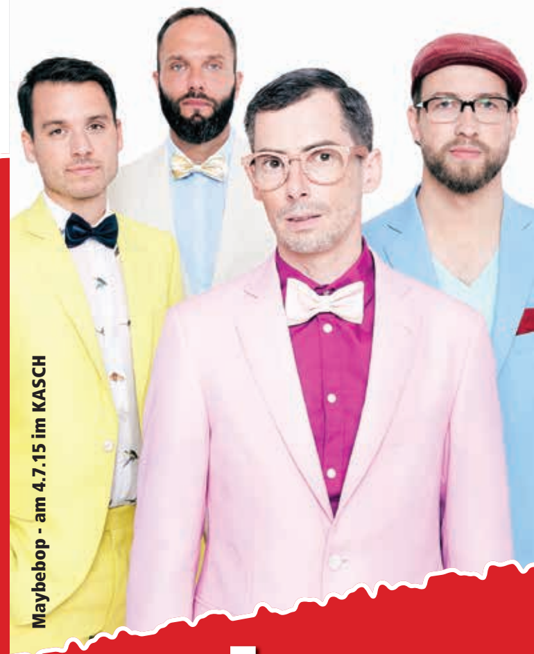
Maybebop - am 4.7.15 im KASCH